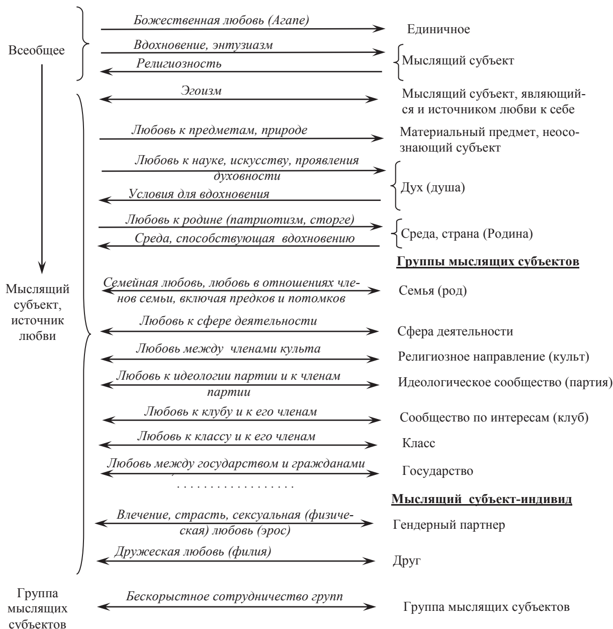
Рисунок 2 – Эскиз онтологии любви

Эскиз онтологии любви, отвечающей Подходу, представлен на рисунке 2. Виды любви образуют сеть, в основе которой лежит иерархия, дополненная связями, когда одни виды любви связаны с другими её видами. Приведённое здесь построение онтологии любви является попыткой вторжения в это фундаментальное понятие с целью выявления максимально достижимых формальных возможностей идентификации любви и выработки эффективных действий по её сохранению и усилению, как отражения гармонии во Всеобщем. В предложенную онтологическую конструкцию вписываются известные систематизации видов любви.