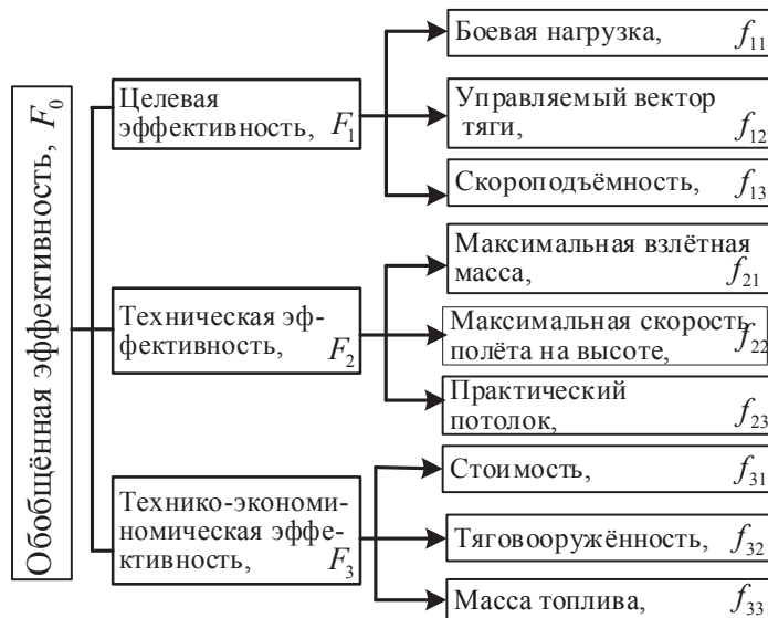
Рисунок 2 – Иерархическое дерево критериев оценки эффективности самолётов