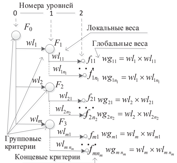
Рисунок 1 – Трёхуровневое иерархическое дерево критериев оценки объектов

Замечание 3. Глобальные коэффициенты, вычисляемые на шаге 5 данного метода, аналогично вычисляются и в методе ПАТТЕРН [2] и в МАИ [1]. При этом глобальный вес конечного критерия в иерархическом дереве характеризует (относительную) долю, которую он вносит в глобальный критерий верхнего (нулевого) уровня иерархии.